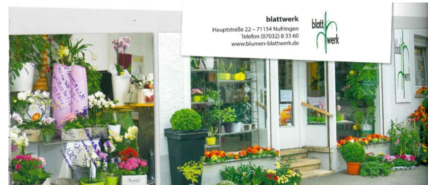
blattwerk Hauptstraße 22 – 71154 Nufringen Telefon (07032) 8 33 60 www.blumenblattwerk.de