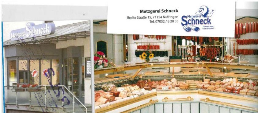
Metzgerei Schneck Breite Straße 15, 71154 Nufringen Tel. 07032 / 8 28 35